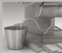
Posuda za otpad