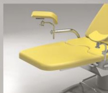
Produžetak za noge