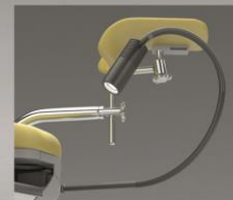
Lampa za pregled